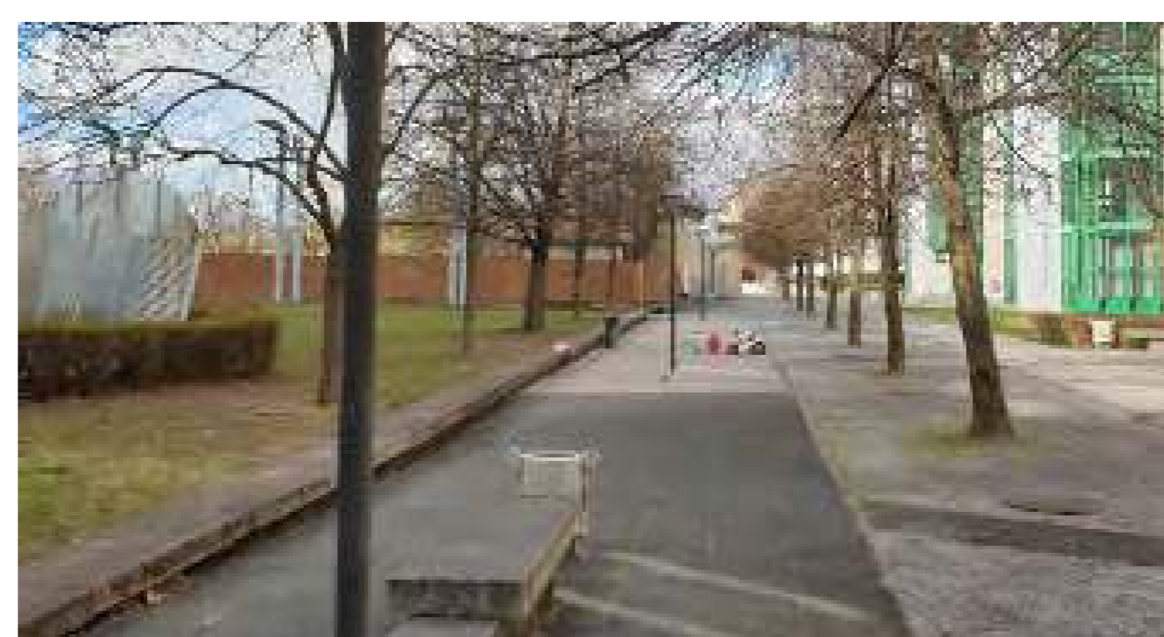
Els alumnes exploren els carrerons del barri