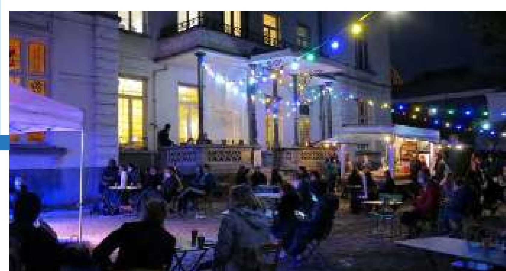
Pati de la Maison des Arts durant el sopar i el concert.