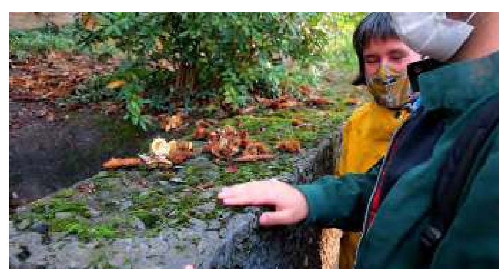
Reflexionant sobre l'experiència del passeig sensorial.