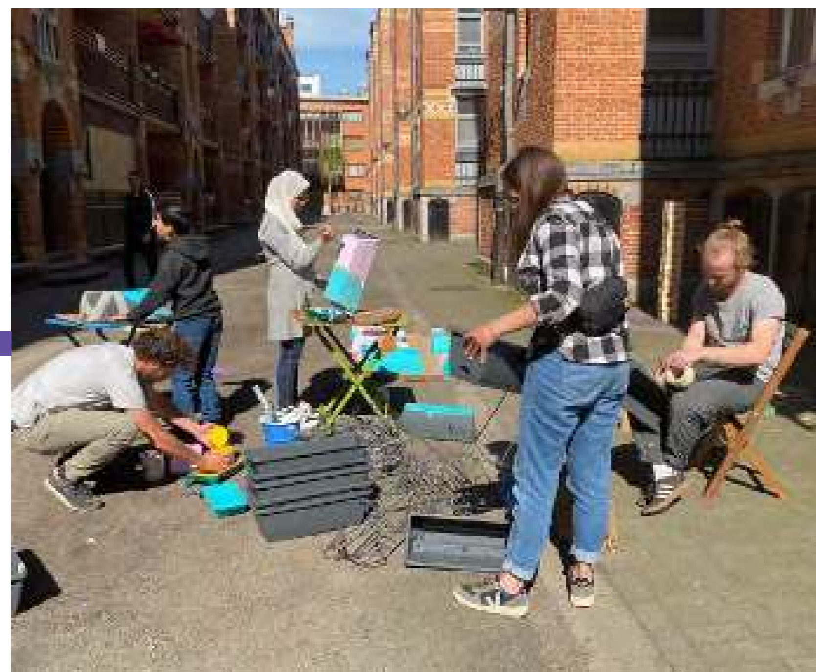
Pintant les jardineres del balcó.

Organitzacions: Alive Architecture, en col·laboració amb BRAVVO Localització: Barri de Marolles, Brussel·les Data: Abril - Juny 2022