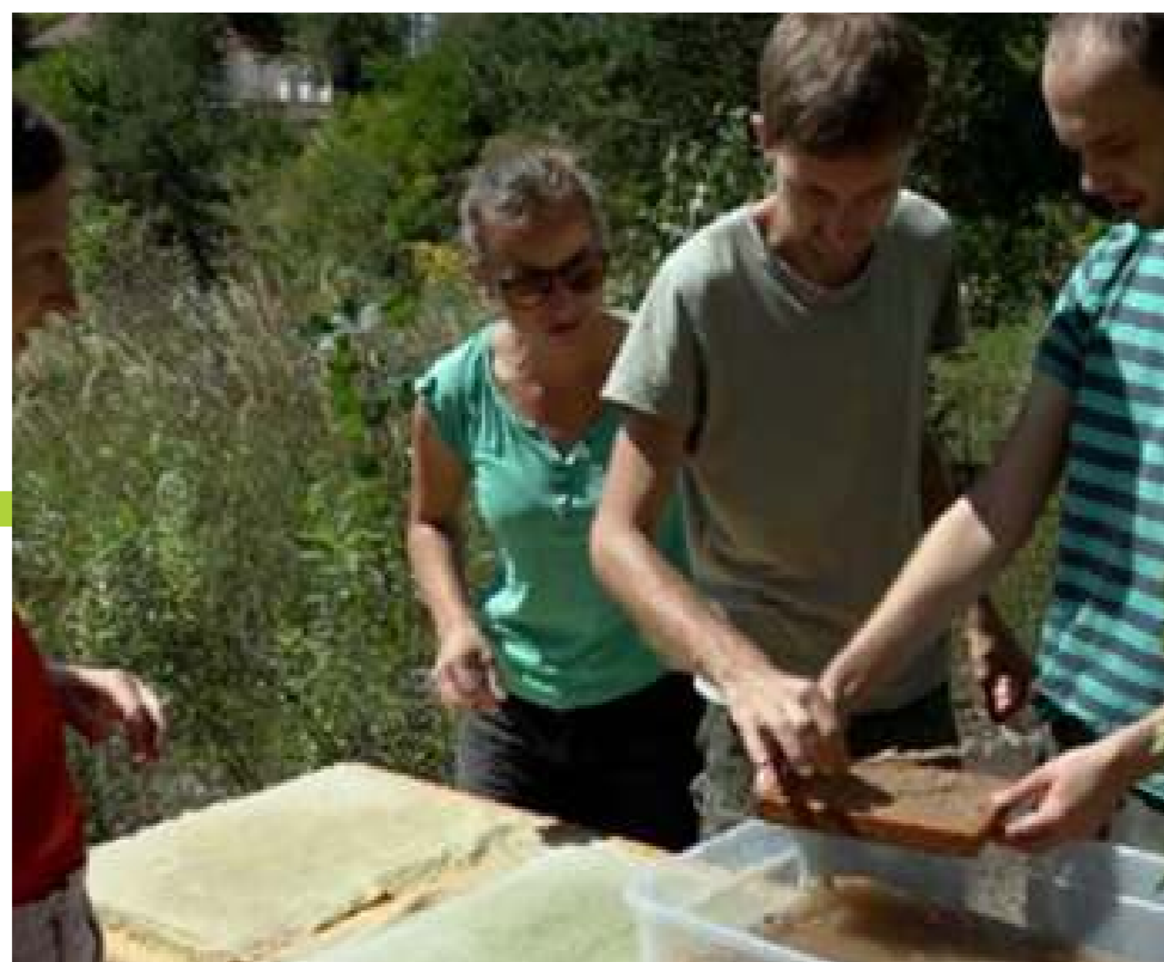
Preparant els tovallons per al sopar comunitari utilitzant les plantes invasores