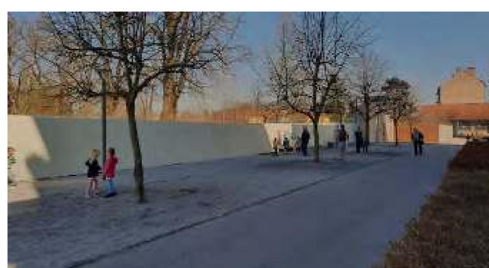
Els alumnes exploren els carrerons del barri

Organitzacions: Facultat d'Arquitectura, Universitat de Liubliana i Prostoroz Localització: Barri de Bežigranski Dvor, Liubliana Data: Març - Maig 2021