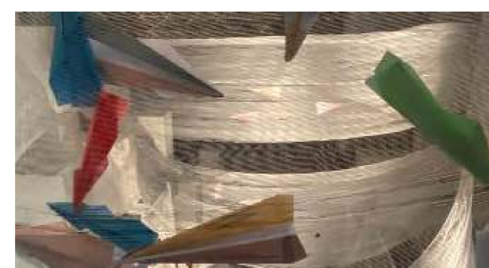
Instal·lació a City Plaza, Nicòsia. Desitjos escrits en peces de papiroflèxia

Organitzacions: Urban Gorillas Localització: City Plaza, Nicòsia Data: Octubre - Desembre 2021