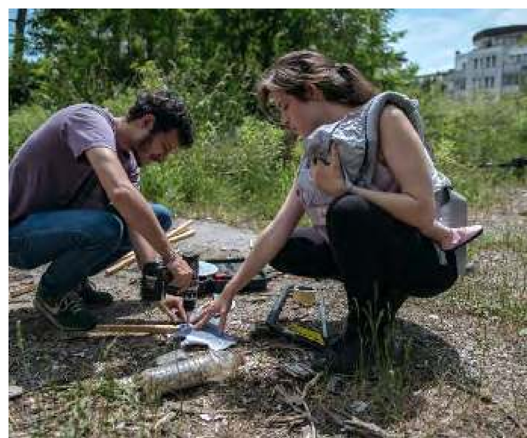
Construint la proposta al solar