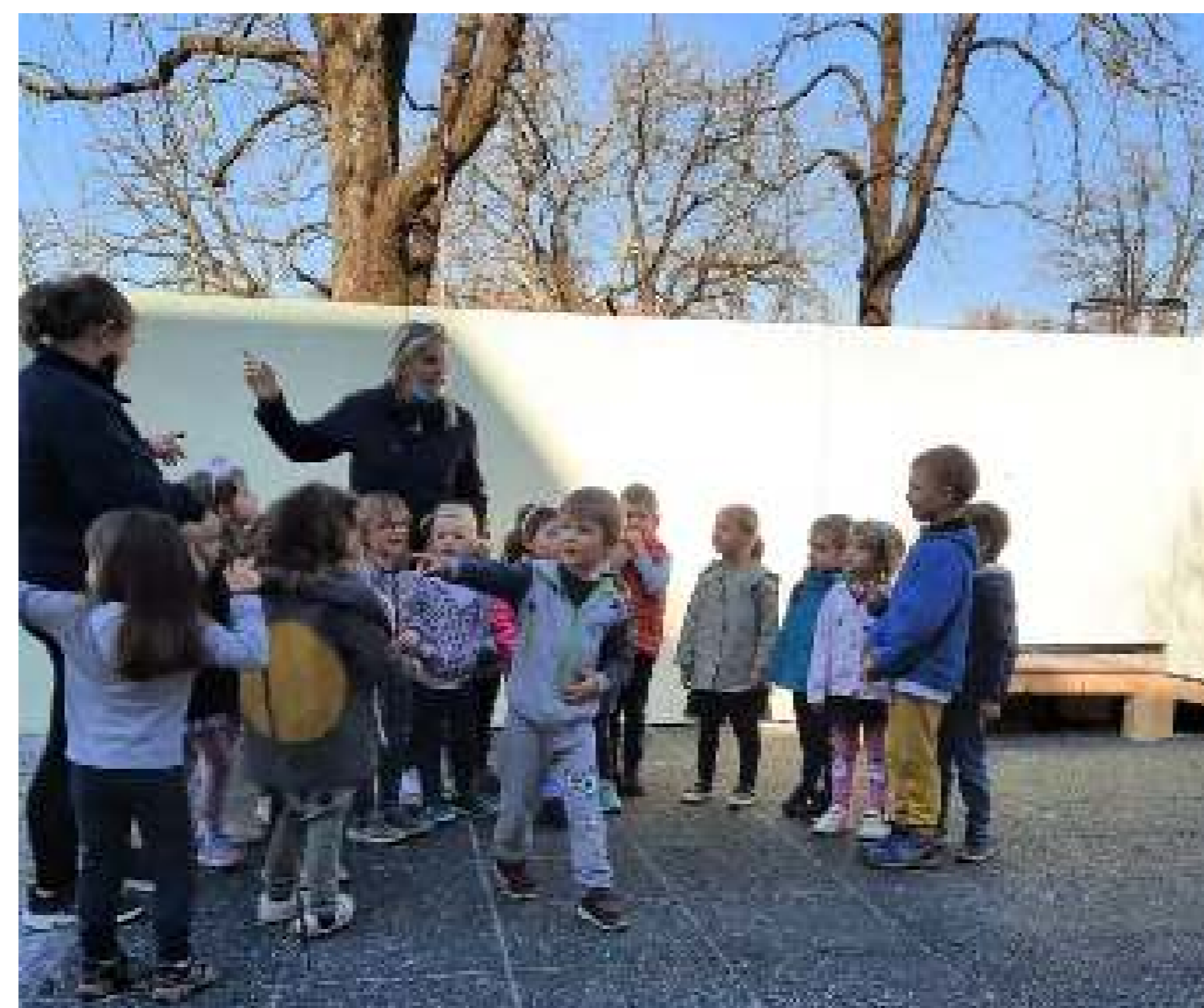
Observant el comportament i el joc dels nens