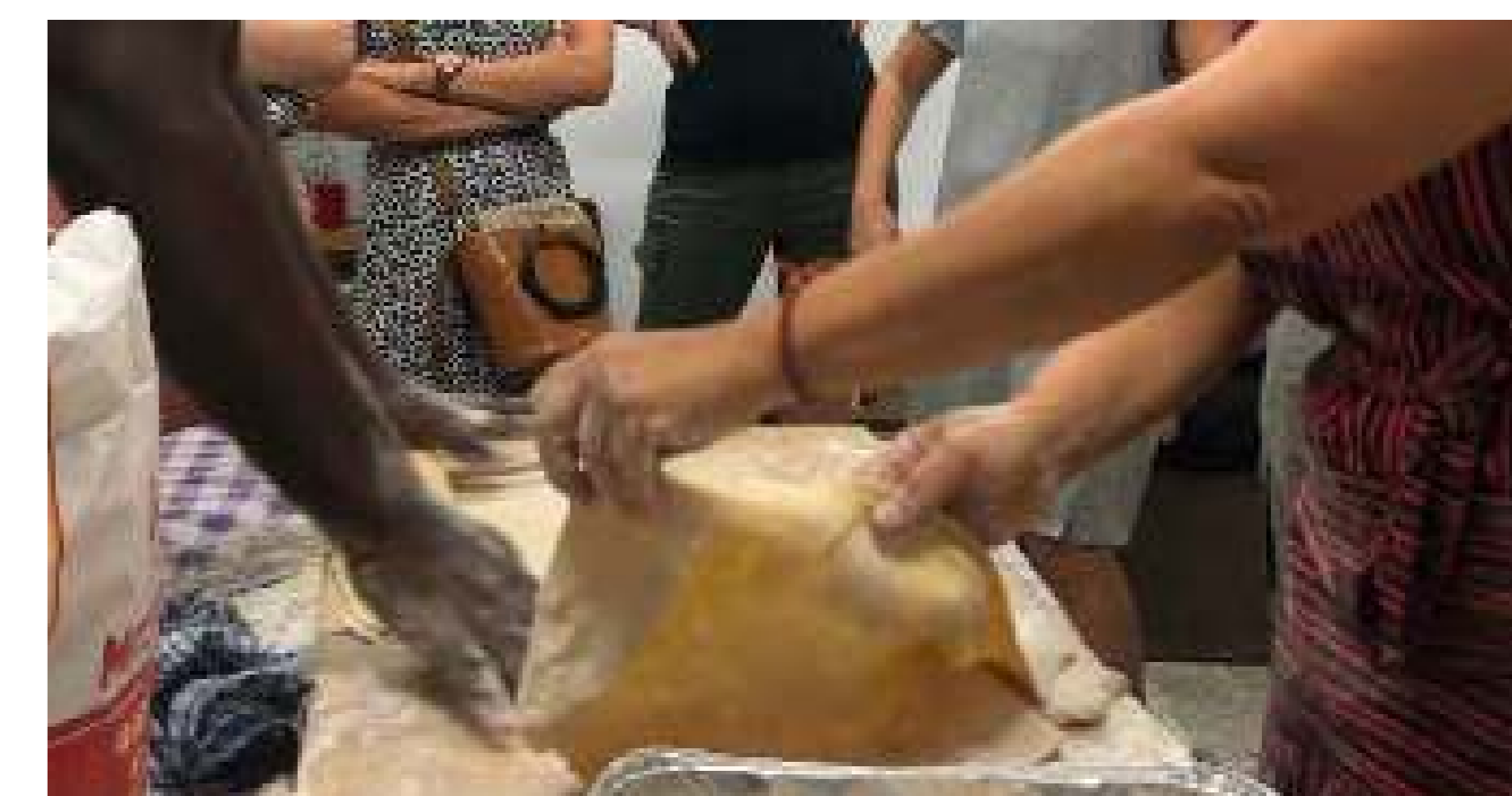
Taller d'elaboració de tallarines seguit d'un sopar a l'espai cultural local Thalami.