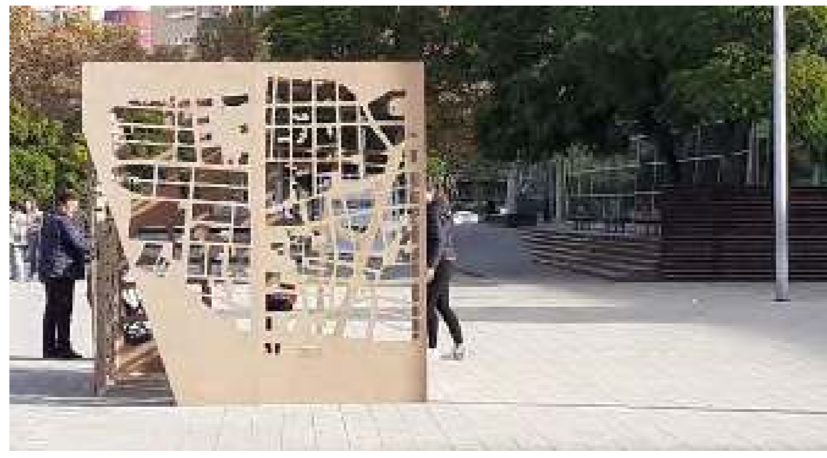
"Omplir el buit", d'Anna Trasserra, estudiant de l'Escola d'Arquitectura La Salle