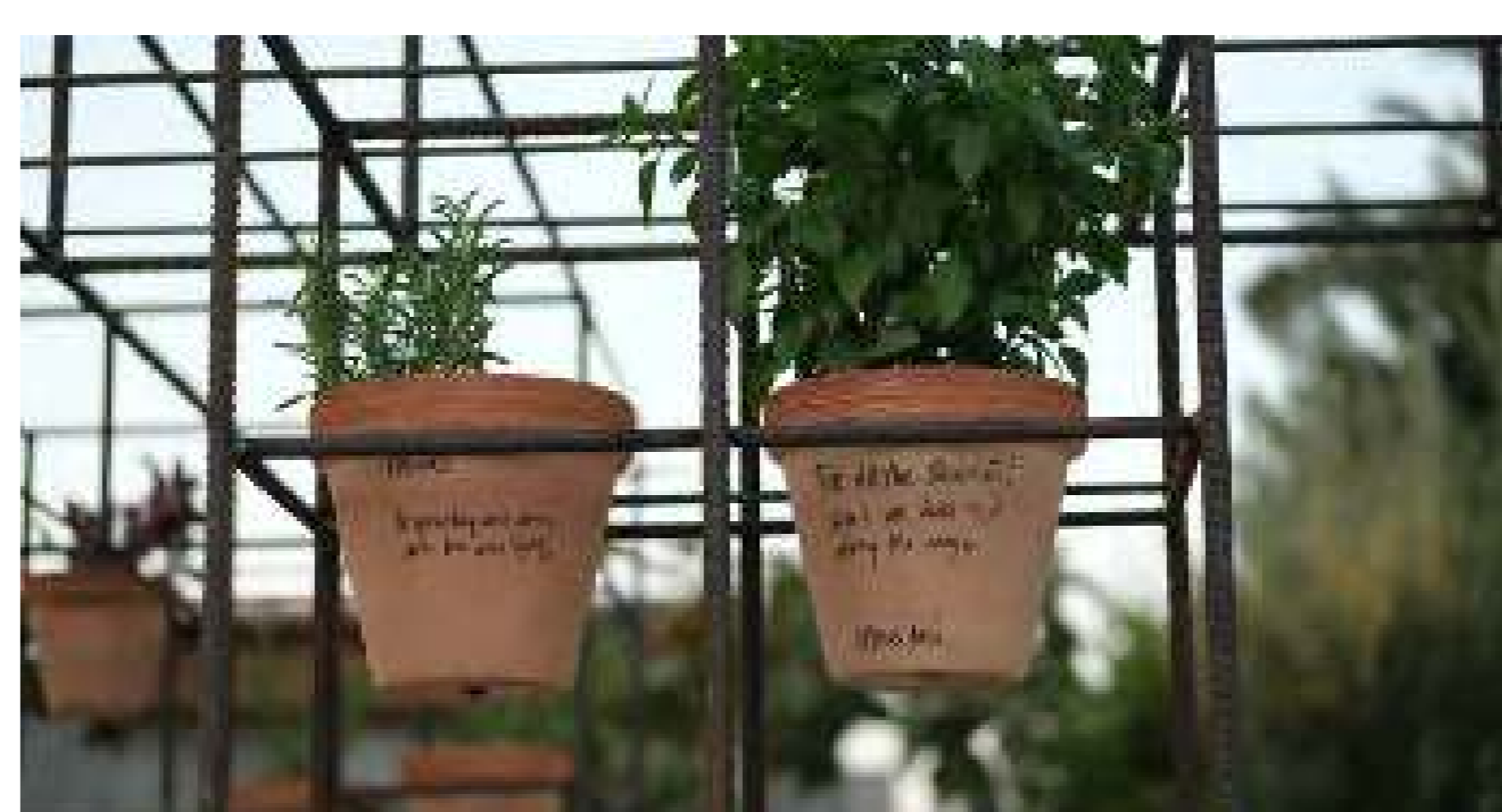
Creació d'un jardí comunitari d'herbes aromàtiques. Font: Urban Gorillas

Organitzacions: Urban Gorillas Localització: Barri de Kaimakli, Nicòsia Data: Abril - Juliol 2022