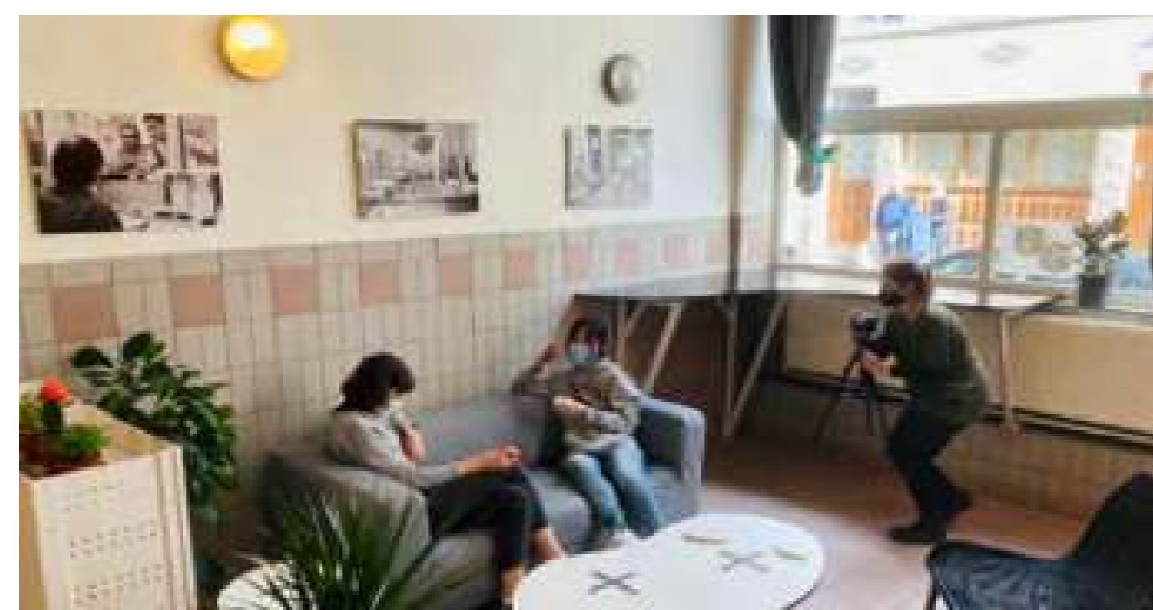
El refugi s'ha actualitzat amb mobles nous

Organitzacions: Departament d'Arquitectura, KU Leuven Localització: Alberg Bodegem Foyer, Brussel·les Data: Abril - Maig 2021