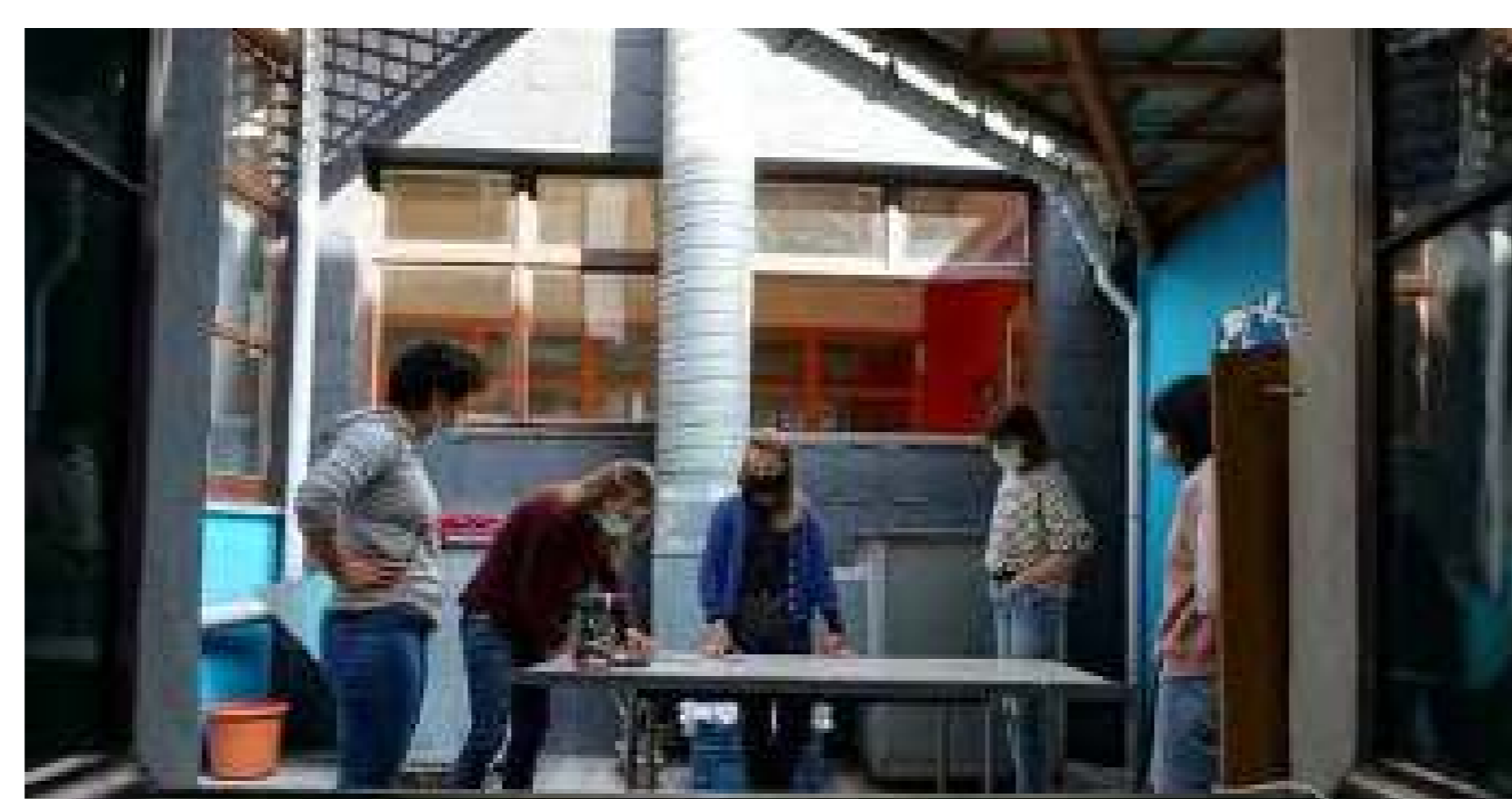
Estudiants aprenent habilitats de fusteria al refugi

"El sentit del lloc és el que fa que una ciutat sigui diferent d'una altra, però el sentit del lloc també és el que fa que valgui la pena tenir cura del nostre entorn físic".