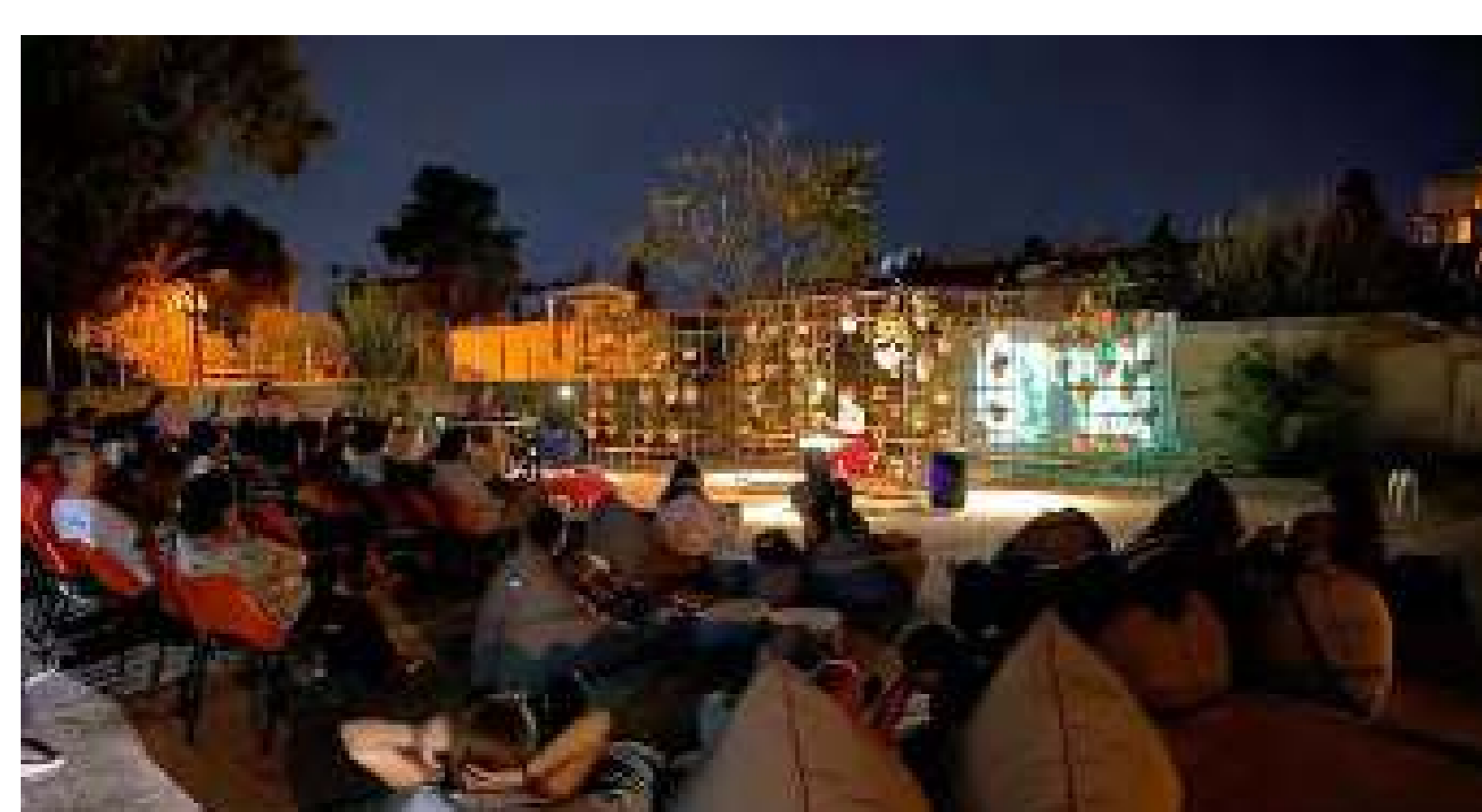
El Jardí Vertical va transformar la plaça en un lloc vibrant

Organitzacions: Urban Gorillas Localització: Barri de Kaimakli, Nicòsia Data: Juliol - Setembre 2020