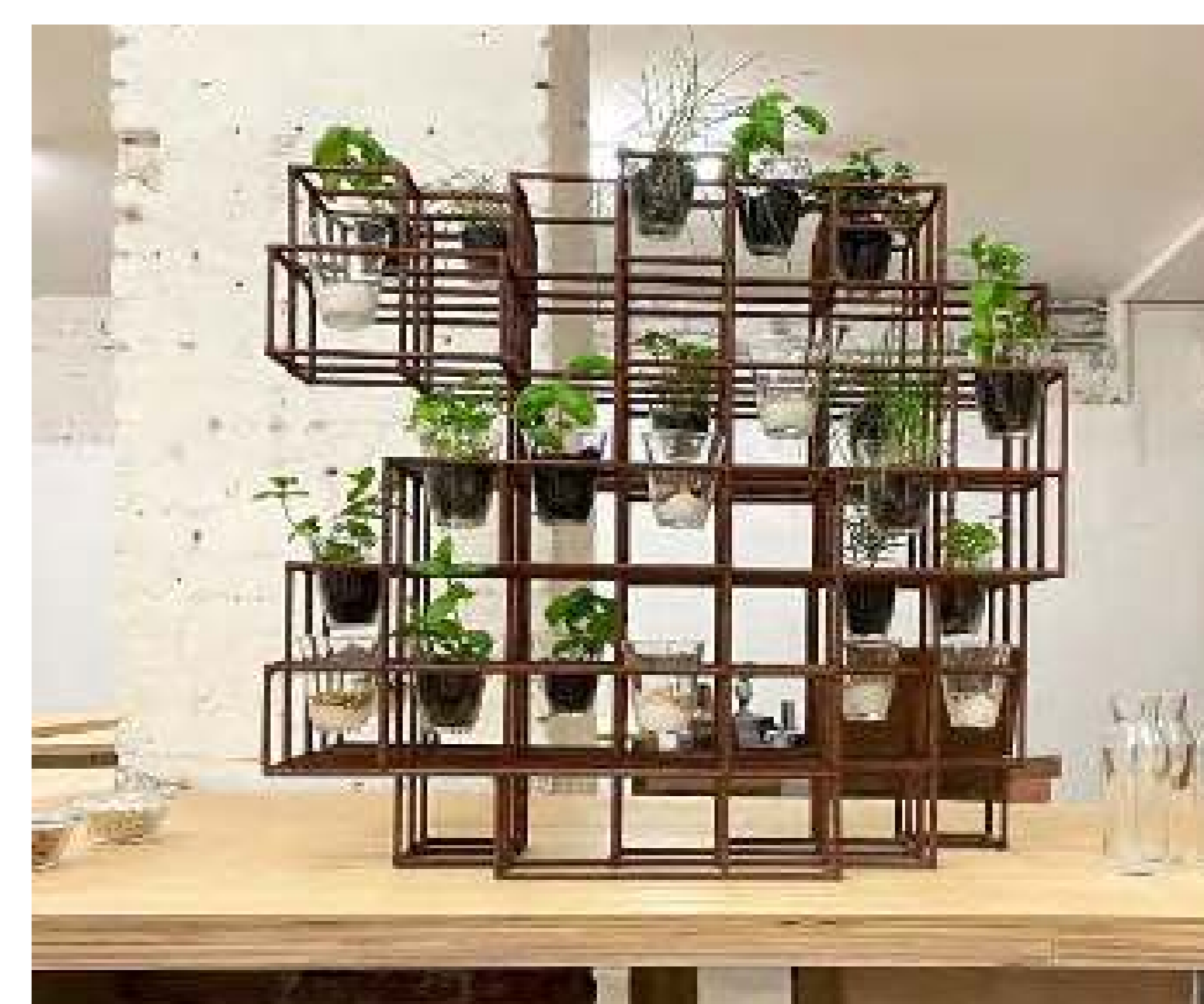
Instal·lació a la Biennal de Venècia

Organitzacions: Urban Gorillas, Alive Architecture, City Space Architecture i Prostoroz Localització: Pavelló de Xipre, Biennal de Venècia Data: Octubre 2021