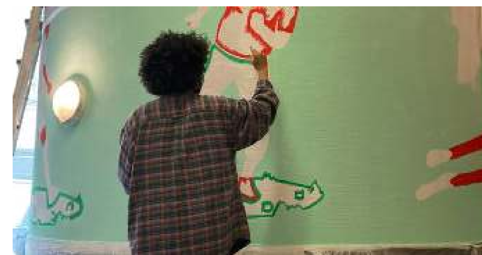
Estudiants i residents infontent vitalitat a l'alberg

Organitzacions: Departament d'Arquitectura, KU Leuven Localització: Alberg Bodegem Foyer, Brussel·les Data: Novembre 2021