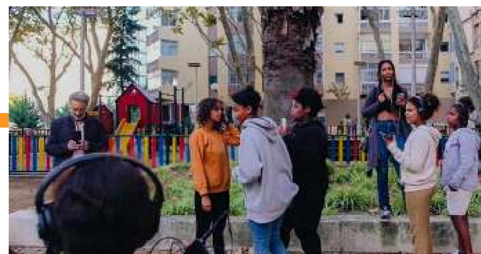
Enregistrament dels sons del barri

Organitzacions: Universidade Nova de Lisboa