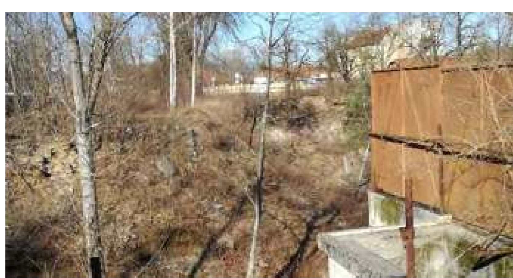
Un entorn natural per transformar-lo en un lloc