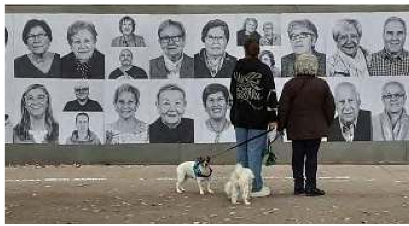
"El valor de Bellvitge", dels alumnes de l'Institut Bellvitge (guanyador d'un premi del públic)