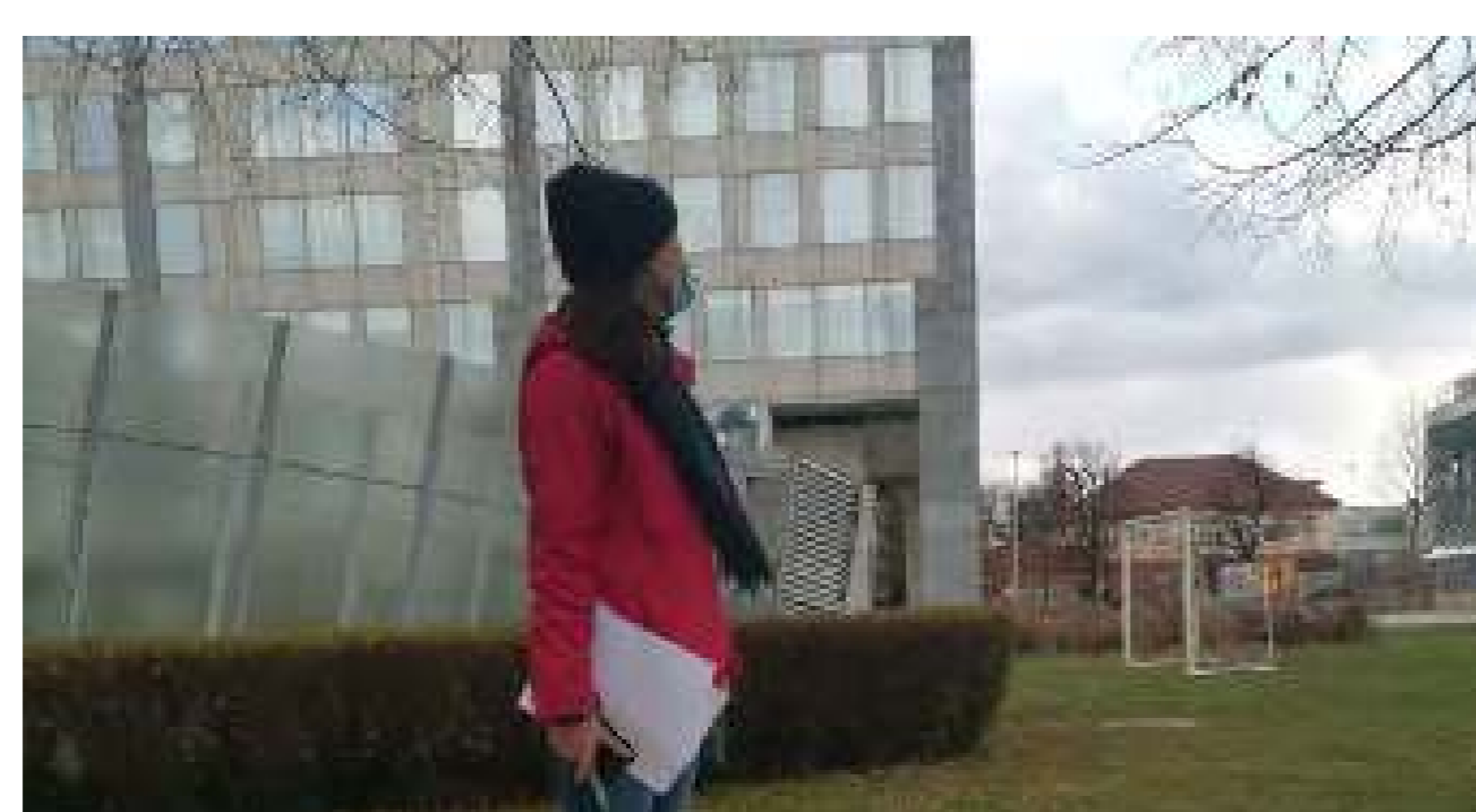
Els alumnes exploren els carrerons del barri