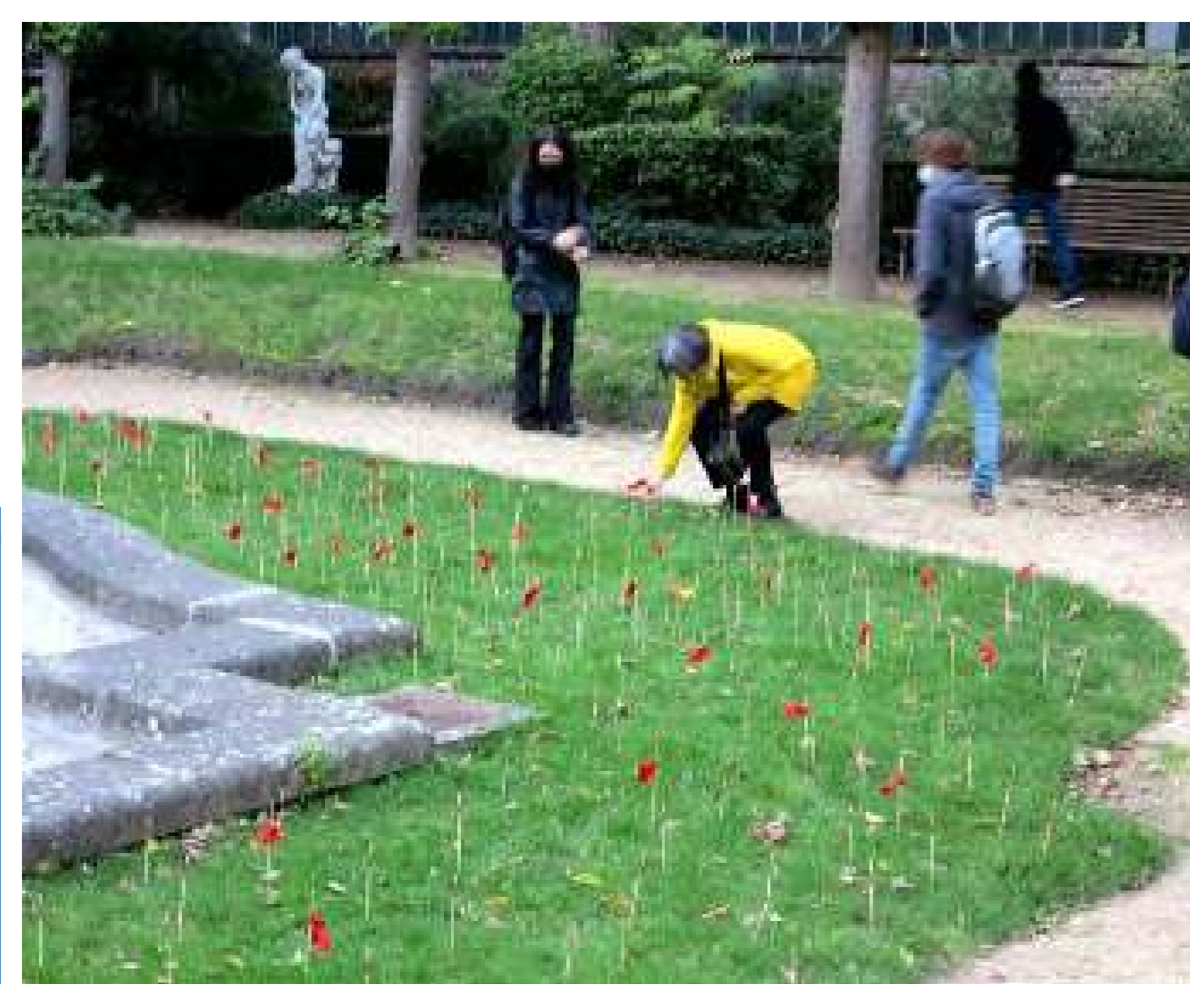
Després del passeig, es van deixar empremtes de les reflexions.