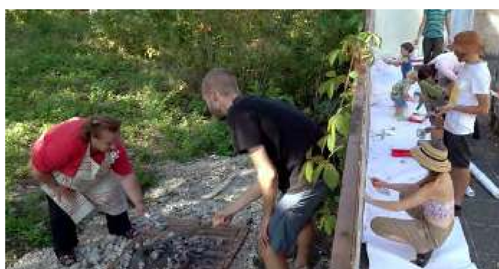
Buscant plantes i pintant la tanca amb els residents