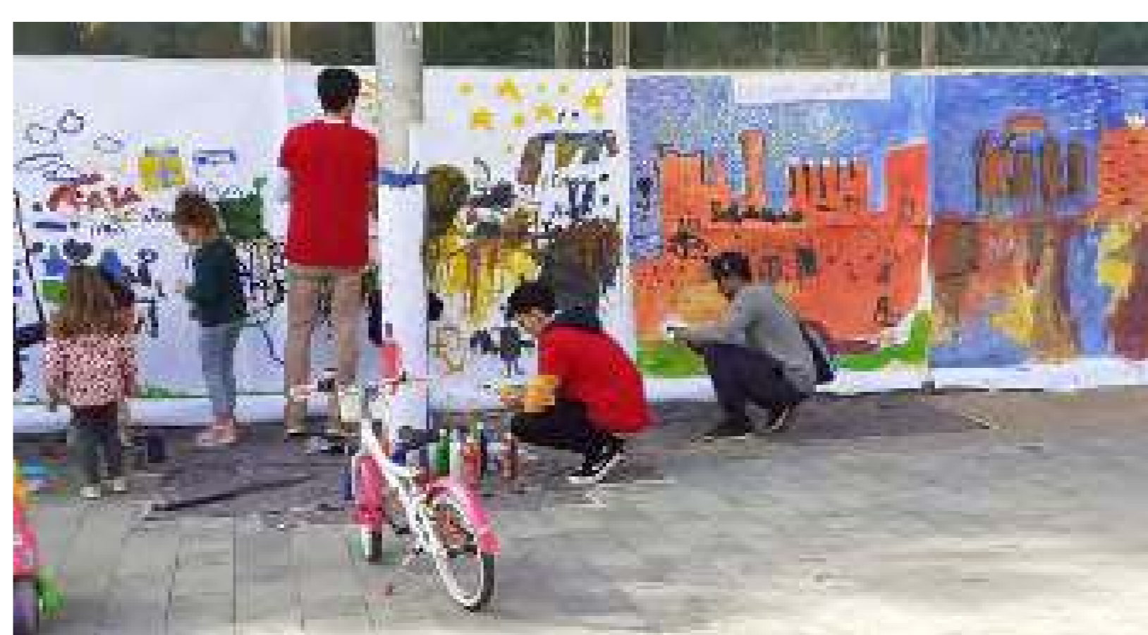
Taller de pintura i dibuix per a nens organitzat per PlayART