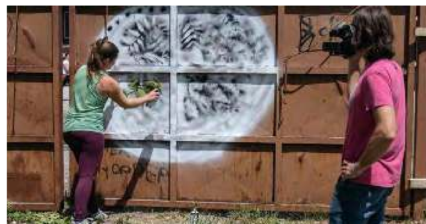
Pintant la tanca que envolta el solar

Organitzacions: Facultat d'Arquitectura, Universitat de Liubliana i Prostoroz Localització: "Krater", barri de Bežigrjski Dvor, Liubliana Data: Març - Juny 2020