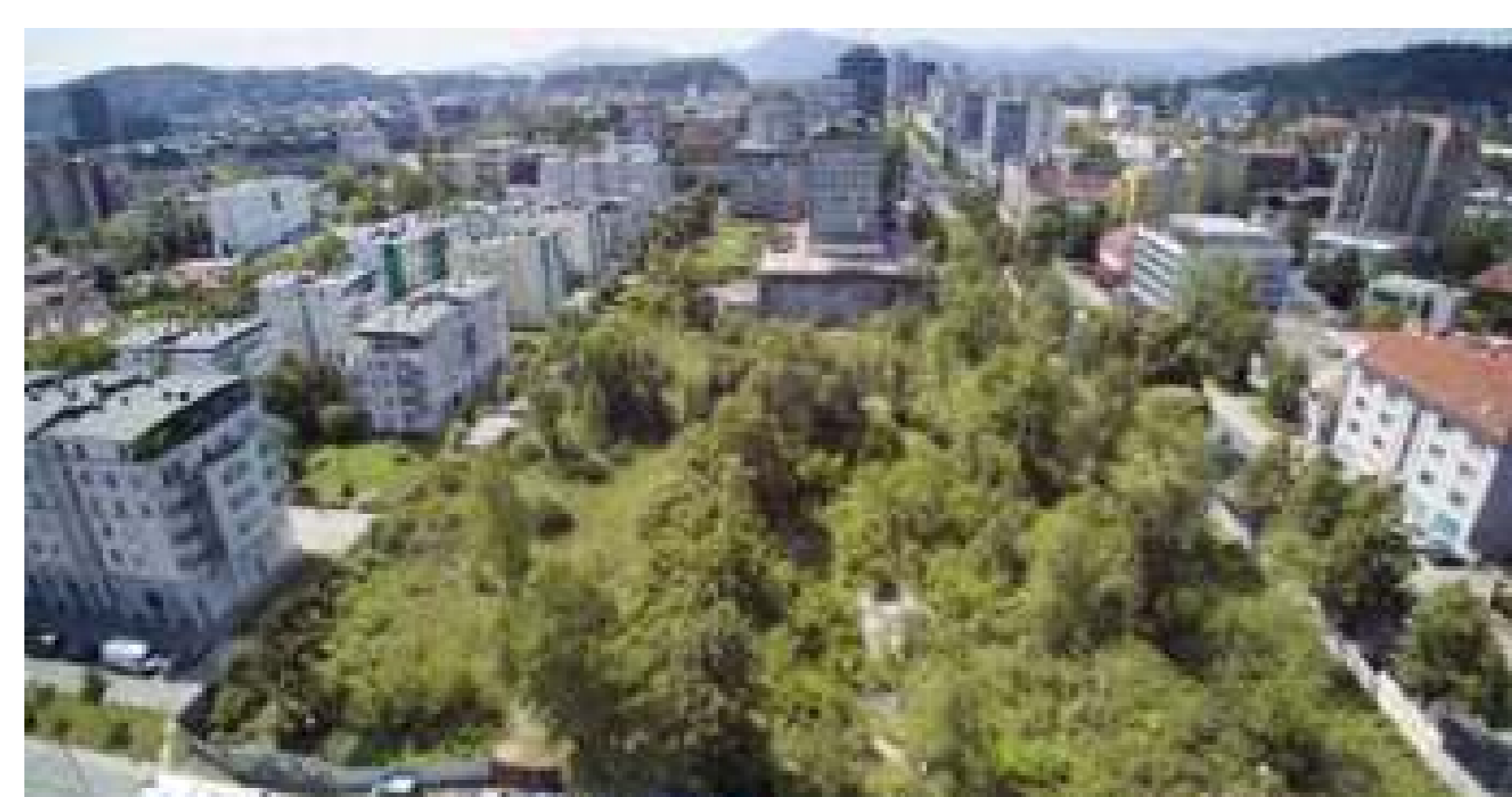
Un lloc ocult: Barri de Bežigrjski Dvor, Ljubljana