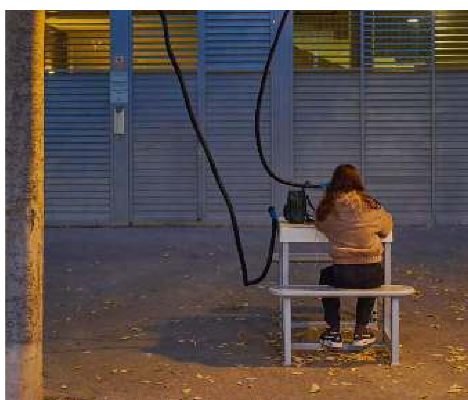
Instal·lació sonora "Líniee d'escotta", d'Alejandro Artigas i Jimmy Solórzano

Organitzacions: Escola d'Arquitectura La Salle Localització: Barri de Bellvitge, L'Hospitalet de Llobregat (Barcelona) Data: 26-27 Novembre 2022