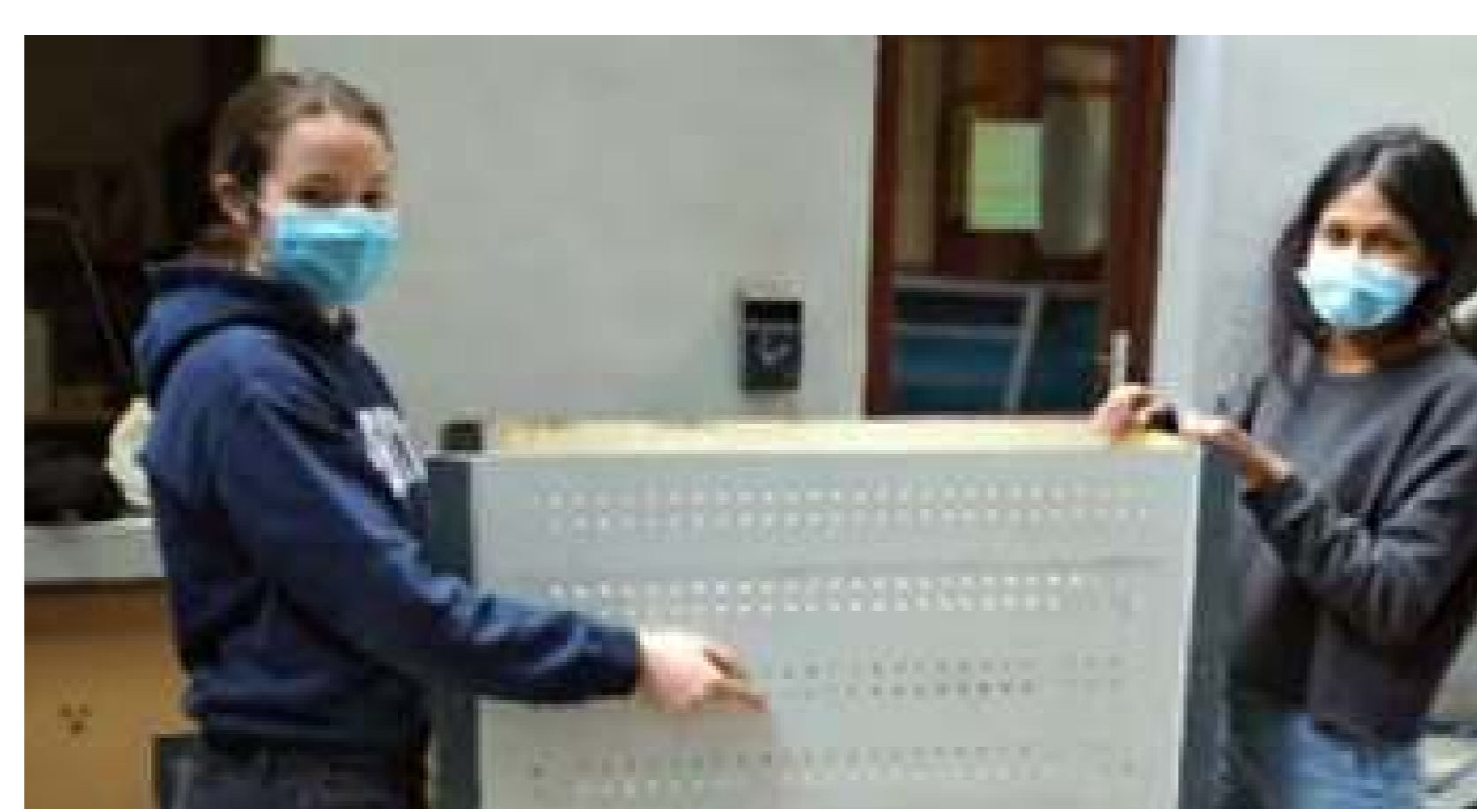
Noves peces de mobiliari reunides en el lloc