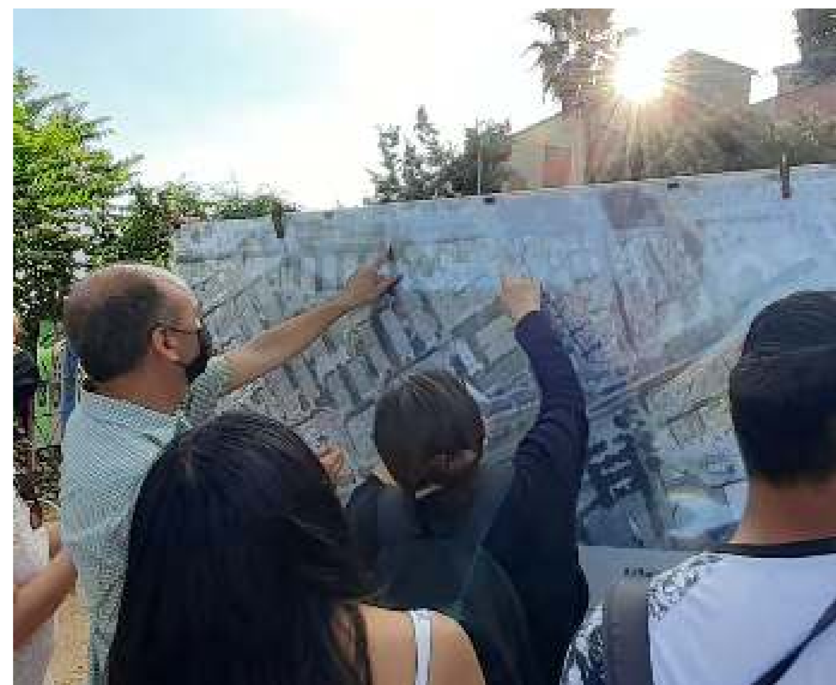
Passeig pel barri de La Florida amb residents de diferents edats i grups socials

Organitzacions: School of Architecture La Salle