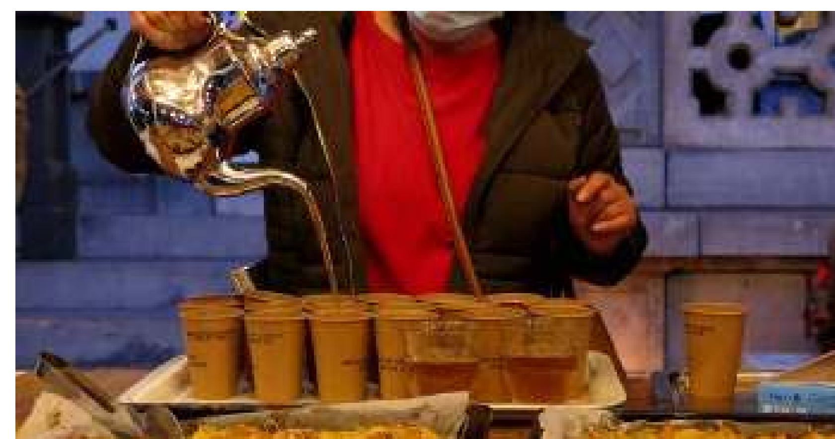
Un sopar comunitari amb dinar turc.

Organitzacions: Alive Architecture i Departament d'Arquitectura, KU Leuven