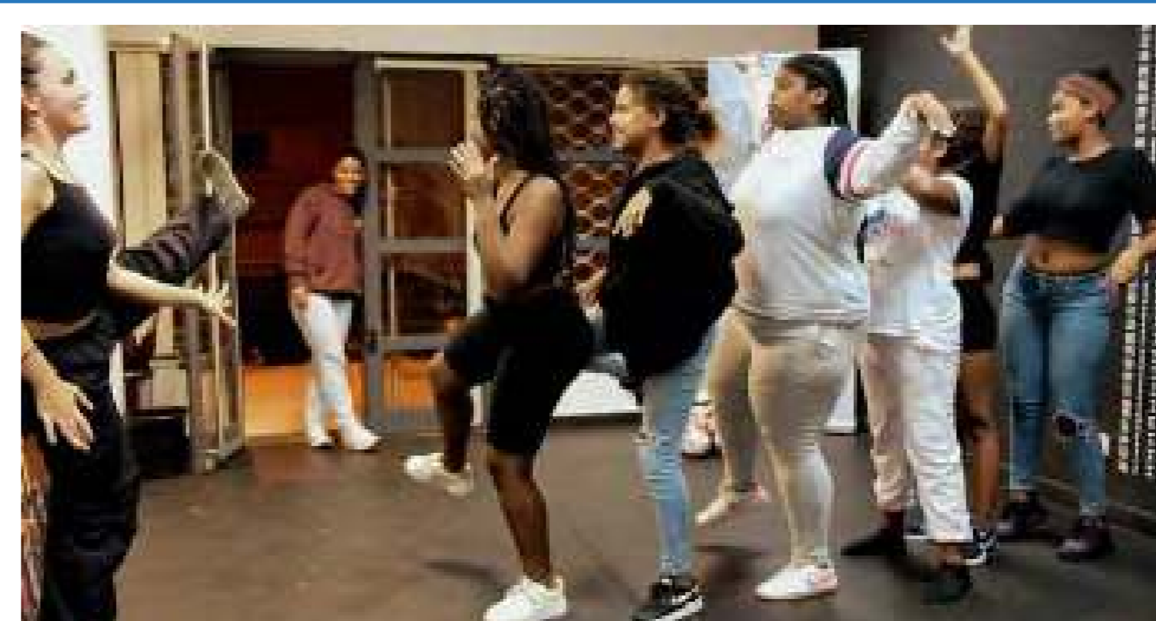
Co-creació d'una coreografia per actuar en un flash mob