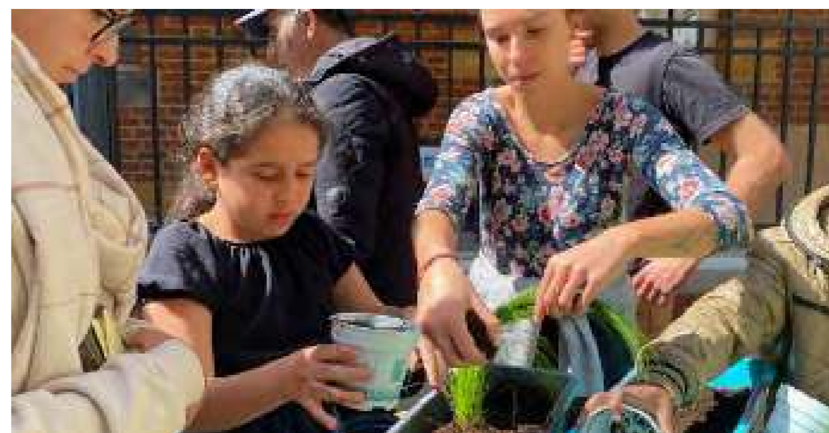
Plantant plantes amb els nens del barri.