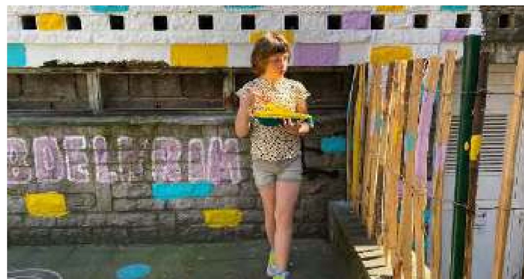
Nens pintant la tanca acabada d'instal·lar.